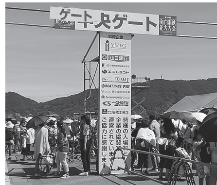
一定額以上のご協賛で場内バナーを 掲示、設置いたします。