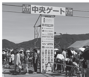
バナー設置例 (協賛一定額以上)