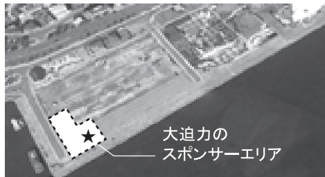
▲スポンサーエリア