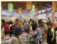
道の駅「北浦街道ほうほく」